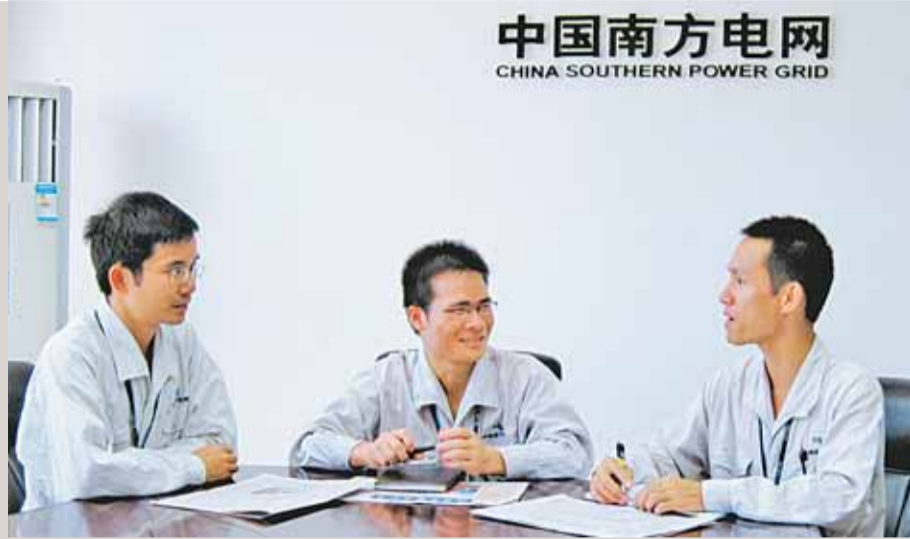
中国南方电网 CHINA SOUTHERN POWER GRID