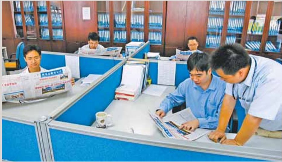
▶广州局检修试验部员工认真学习公司半年工作座谈会精神。