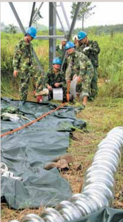
▲柳州局员工不畏酷暑实施带电作业,消除安全隐患。